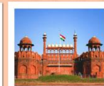
♡♡ Agra Fort