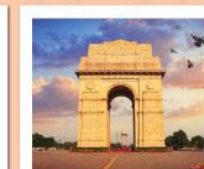
♡♡ India Gate