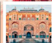
♡♡ Amber Fort